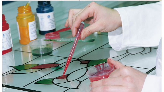
Le savoir-faire de l'atelier miroiterie de Volma réunit 7 techniques : impression numérique, sablage, vitrofusion, pièces de verre biseautées, film et plomb, Résicolor et inserts usinés